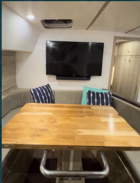
Mesa Hidraulica do Salao